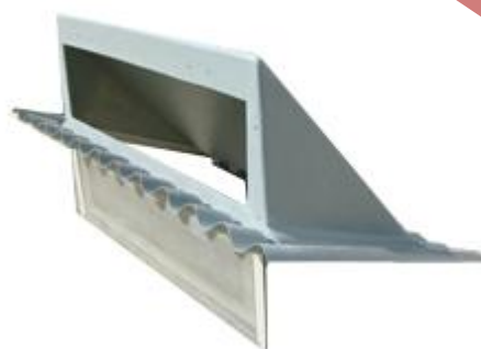
Modelo aislamiento de poliuretano