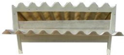
Modelo sin aislamiento poliuretano